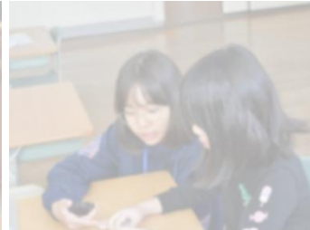
(播磨高原東小学校)