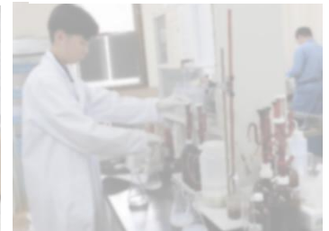
(播磨高原広域事務組合)