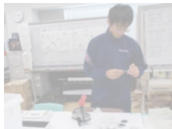
(放射光科学研究センター)