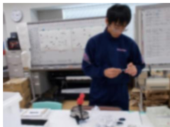
(放射光科学研究センター)