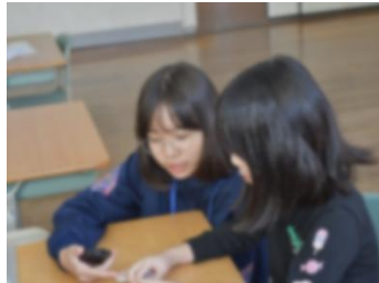
(播磨高原東小学校)