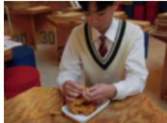
(ひょうご環境体験館)