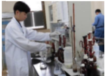
(播磨高原広域事務組合)