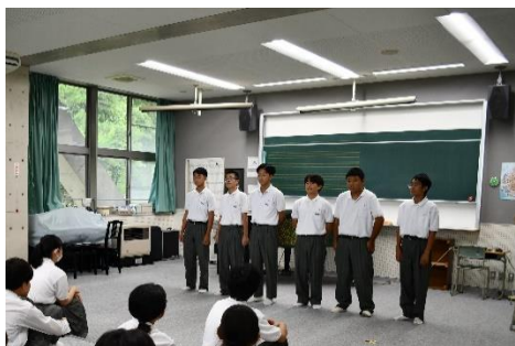
< 壮行会にて決意表明 >