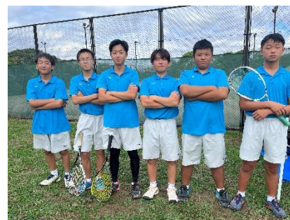
< 大会会場にて >