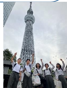
<東京スカイツリー>